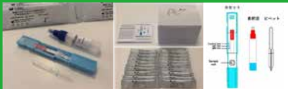
COVID-19 IgG/IgM Antibody Testキット 製造元:ALFA SCIENTIFIC DESIGNS社(米国) ※本製品はUS FDA EUA登録済みです。またはこれに準じた精度のキットを使用します。